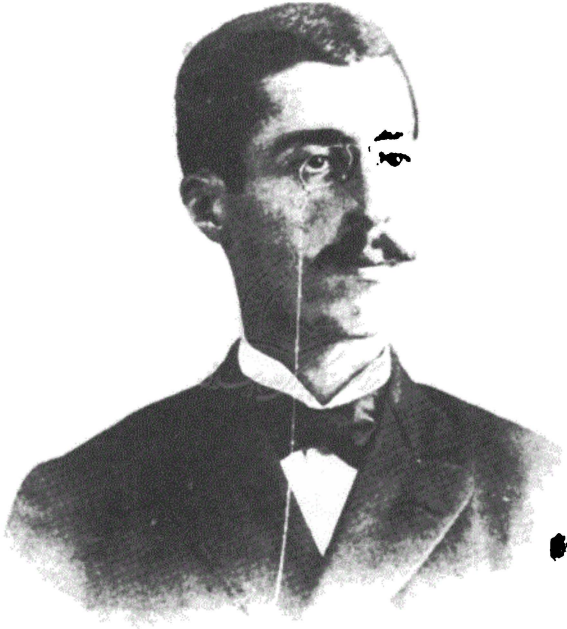
الأمير شقيب في الخامسة والعشرين من عمره - كانون الثاني ١٨٩٥